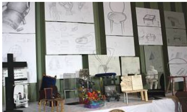
Beisp.: Stuhlmodelle zum Film „Das weiße Band“, S1